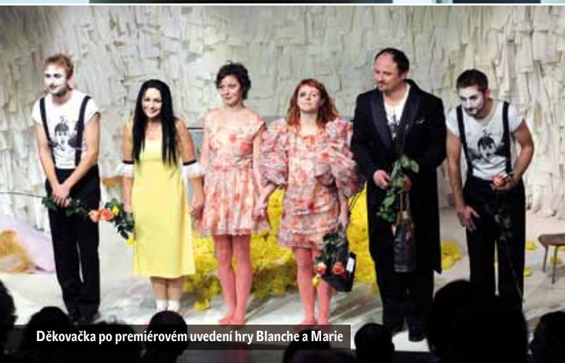
Děkovačka po premiérovém uvedení hry Blanche a Marie