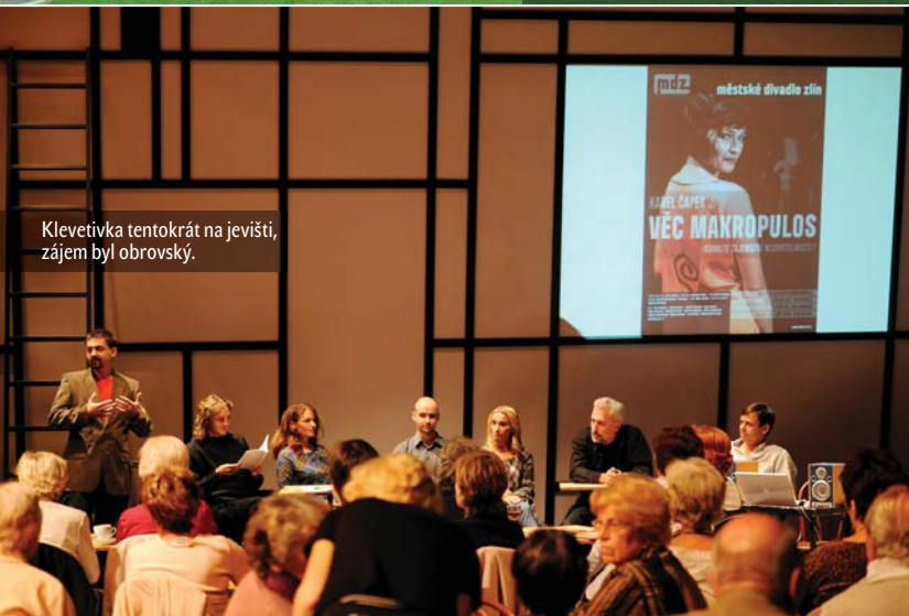
Klebetivka tentokrát na jevišti, zájem byl obrovský.