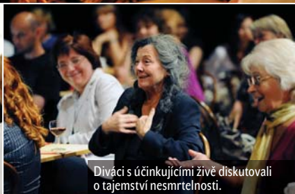
Diváci s účinkujícími živě diskutovali o tajemství nesmrtelnosti.