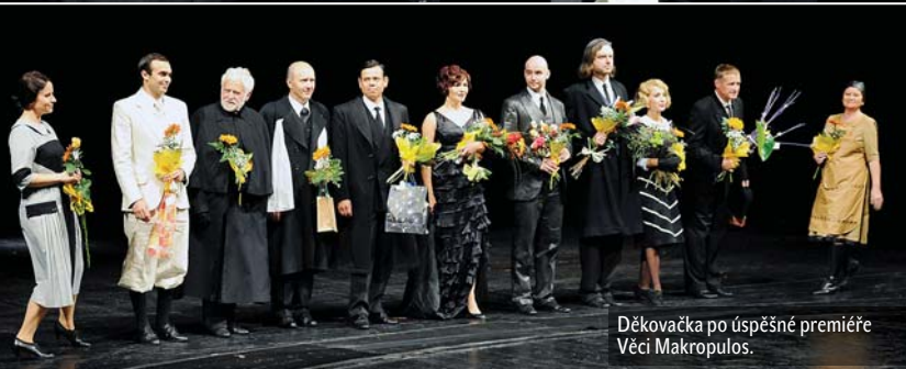
Děkovačka po úspěšné premiéře Věci Makropulos.