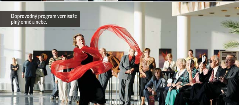
Doprovodný program vernisáže plný ohně a nebe.