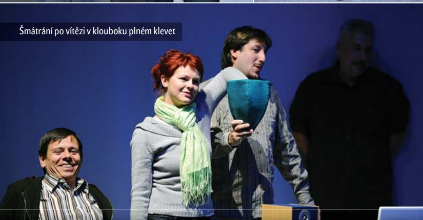
Šmátrání po vítězi v klouboku plném kletev