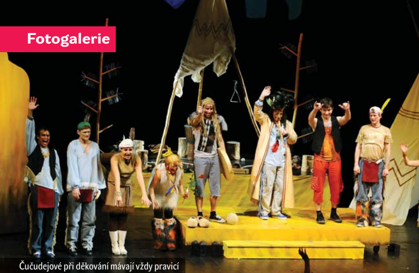
Čučejevojé při děkování mávají vždy pravici