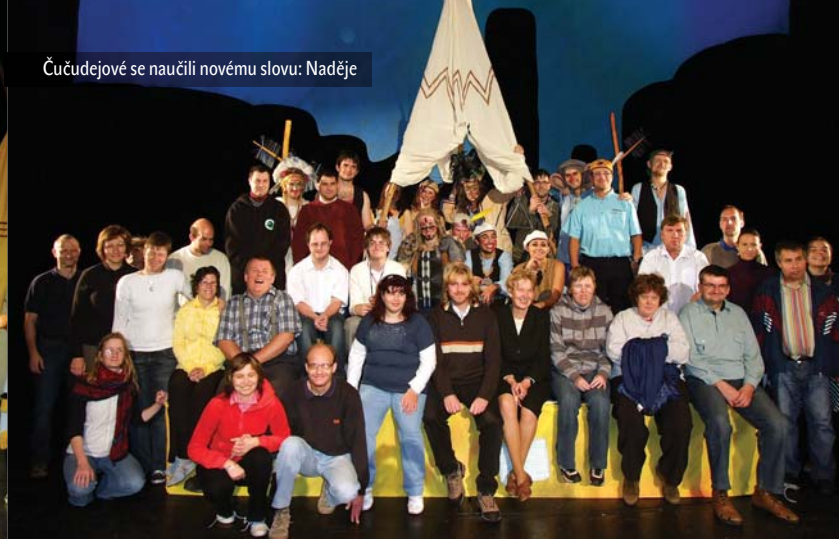
Čučejevojé se naučili novému slovu: Naděje