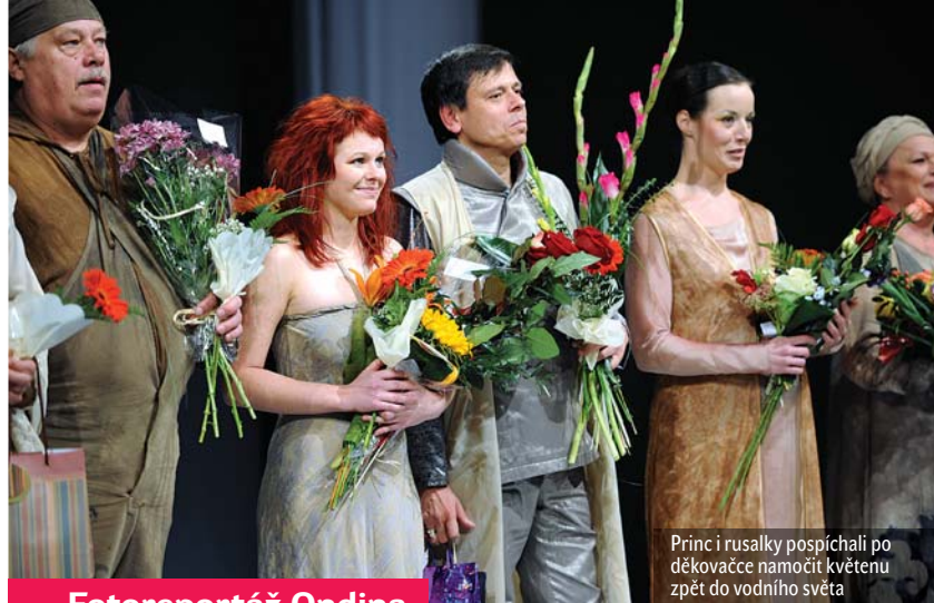
Princ i rusalky pospíchali po děkovačce namočit květenu zpět do vodního světa