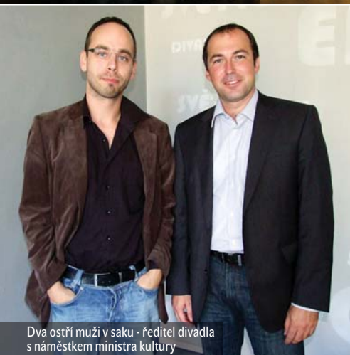
Dva ostří muži v saku - ředitel divadla s náměstkem ministra kultury