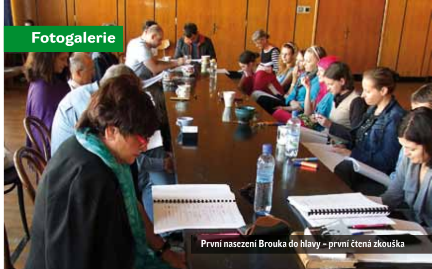
První nasezení Brouka do hlavy – první čtená zkuška