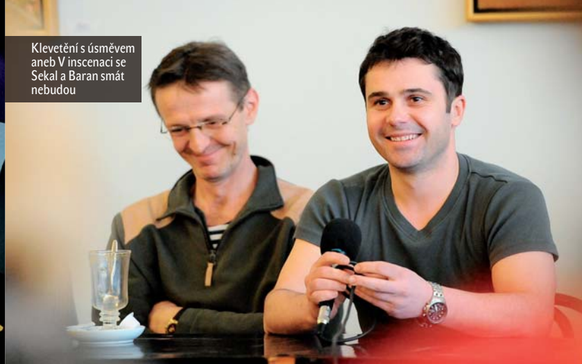
Kleветění s úsměvem aneb V inscenaci se Sekal a Baran smát nebudou