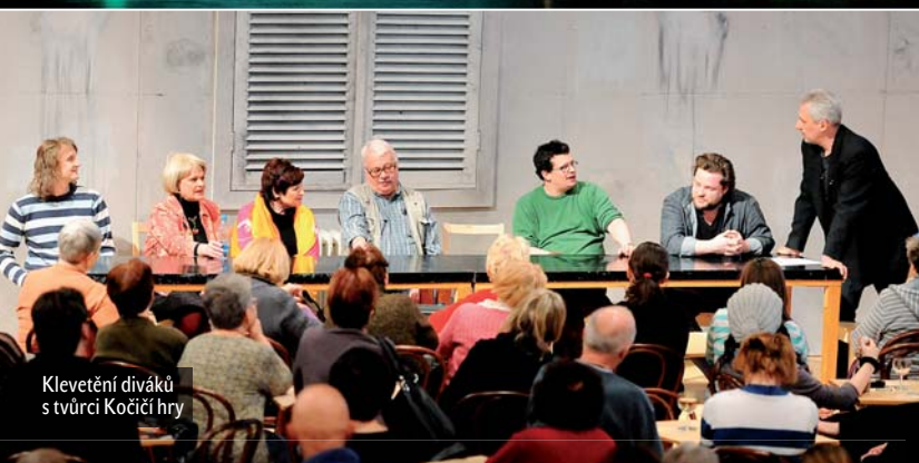
Kleветění diváků s tvůrci Kočičí hry