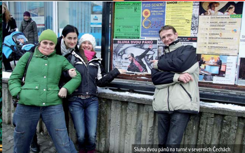
Sluha dvou pánů na turné v severních Čechách