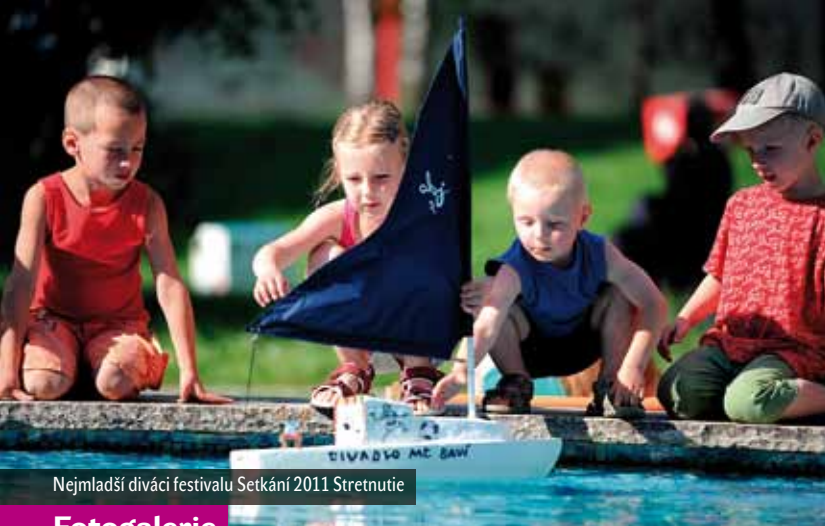
Nejmladší diváci festivalu Setkání 2011 Stretnutí