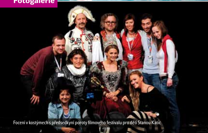
Focení v kostýmech s předsedkyní poroty filmového festivalu pro děti Stanou Katic