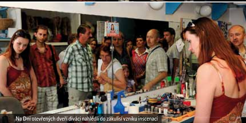
Na Dni otevřených dveří diváci nahlédli do zákulisí vzniku inscenací

Podívejte se na náš Facebook: www.facebook.com/divadlo.zlin