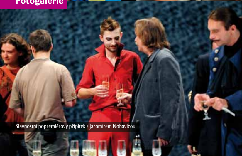
Slavnostní popremiérový připitek s Jaromírem Nohavicou